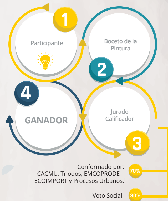
Figura1. Diagrama del Concurso "Pintando con Mente Verde"